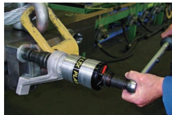
±5%高精度トルク管理