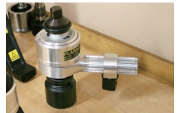
特殊ストレートチューブ型反力受け