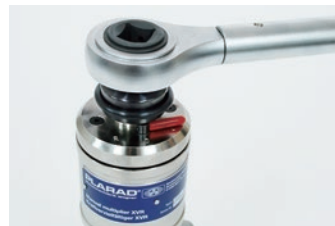
回転方向切替レバー