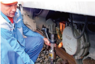
下向き作業でもレンチが落下しません!