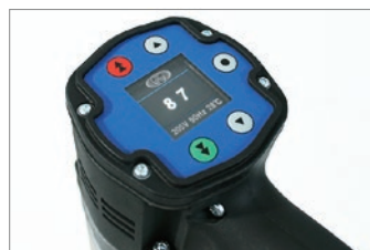
DE1-docu：トルク設定「99段階」 締付繰返し精度 ±5%のトルク管理。