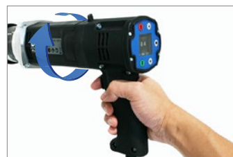
360度回転するフリージョイント構造で 反力で手が、ねじれずハンドル位置 を安全に確保。