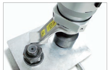
隣のボルトで反力を受け。締付完了の 自動停止と同時に反力受けが自動的 にボルトから離れて噛み付きません。