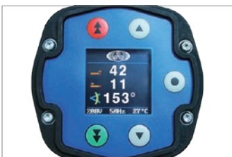
docuプラス：角度締め電動トルクレンチ トルク99段階+角度設定 0~999° トルク管理+角度管理を自動締付け。