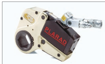
油圧トルクレンチ VS型