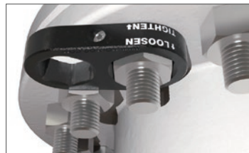
ハンズフリー共回りストッパー