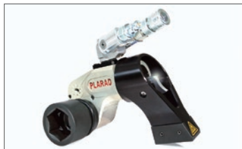
油圧トルクレンチ SC型