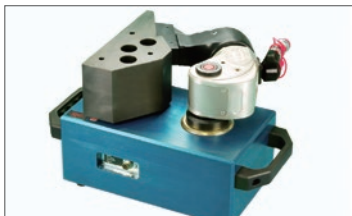
トルク検定・校正サービス