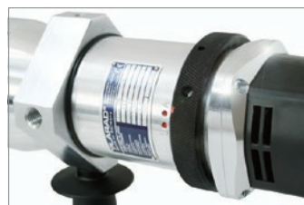
ST-T 自動型：高低速スピード自動変速 構造でハイスピードなトルク管理。