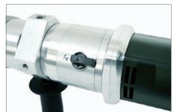
STM マニュアル型：高低速スピード2段 切替レバー式。トルクレンジ幅が広い。